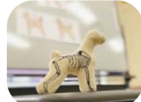
人形を使って骨格を学びます。