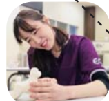
実習前は念入りにチェック。